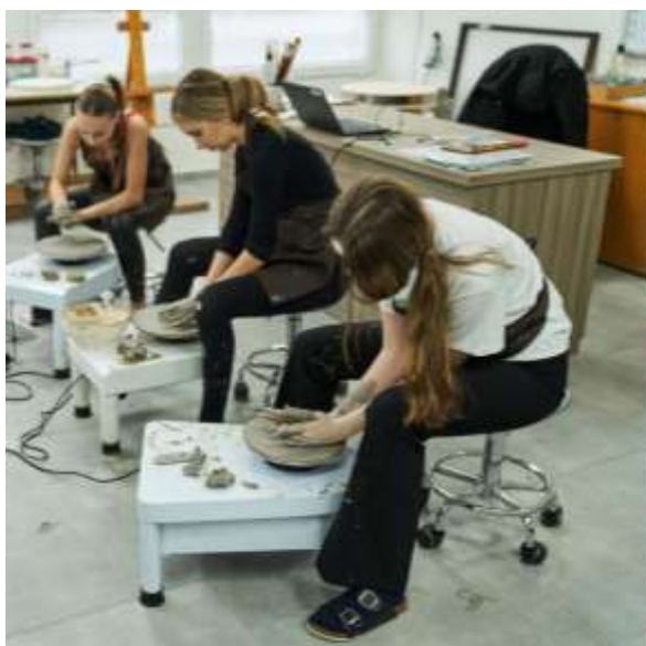
Práca na hrnčiarskych kruhoch a výroby z hliny

Škola a jej žiaci prejavili svoj kladný vzťah a záujem o techniku, tradície a remeslá zorganizovaním výstavy s názvom „Dobrodružná cesta technikou“, na ktorej sme sa osobne zúčastnili. Návštevníci mali možnosť vidieť zaujímavú cestu techniky, jej výdobytkami a spoznali jej dôležitosť v našich životoch od minulosti až po súčasnosť.