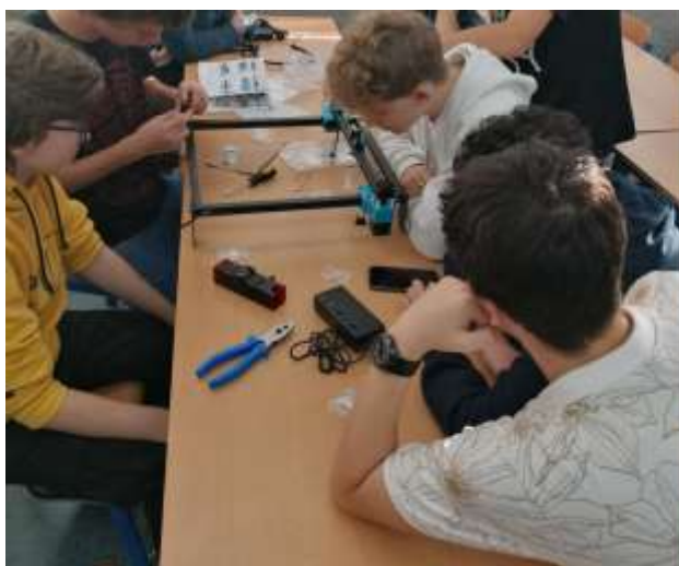
Práca žiakov s laserovou vypaľovačkou