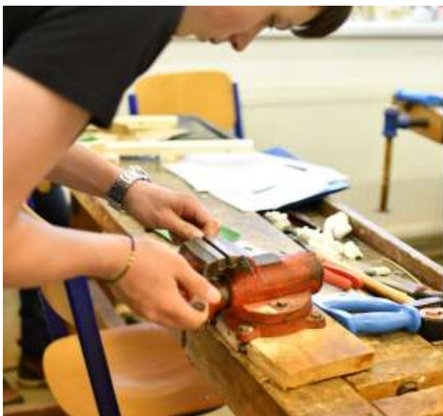
Technická olympiáda v školskom .roku 2022/2023

a pomocou v ich ďalšom vzdelávaní, a že aj naša podpora prispeje k ich snahe a motivácii zlepšovať sa a dosahovať pekné výsledky a úspechy aj v budúcnosti.