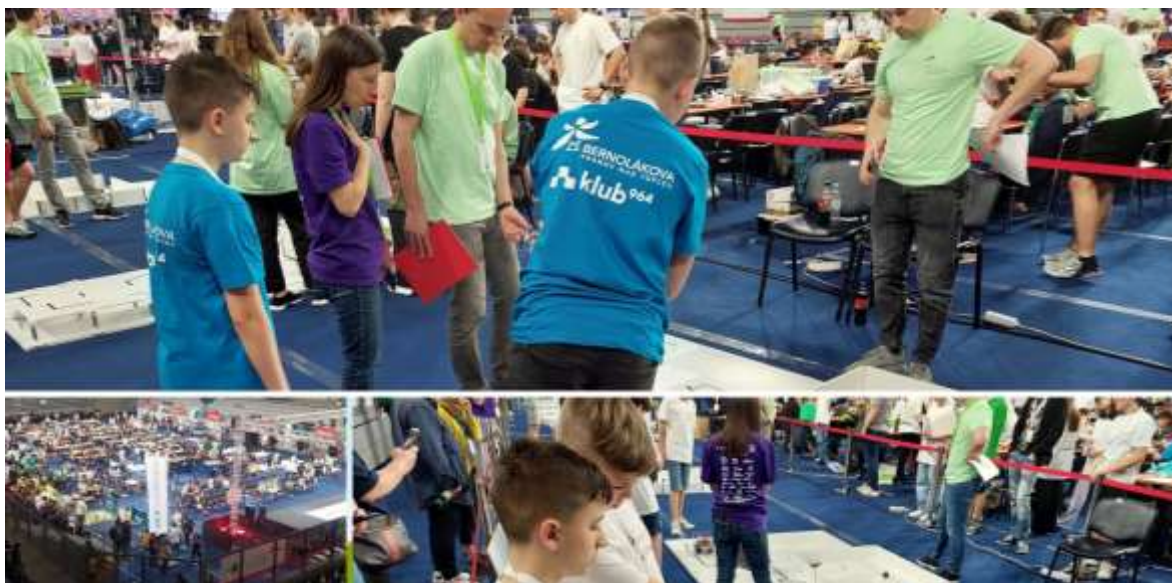
Majstrovstvá Európy v robotike