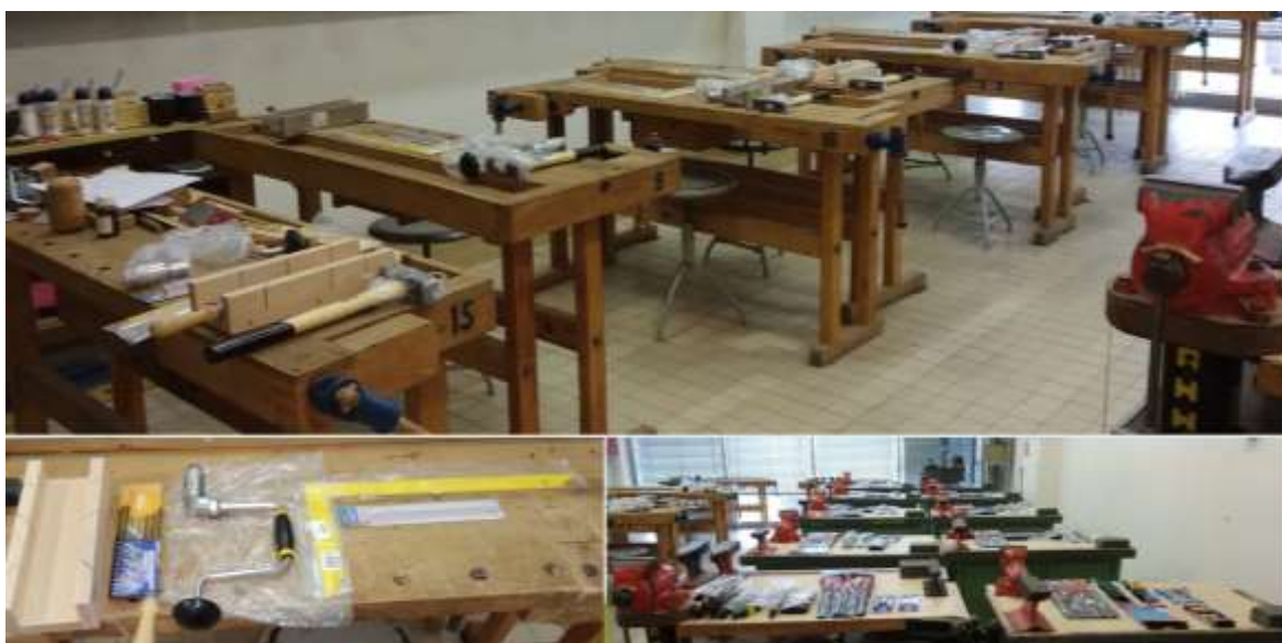
Zmodernizované pracovisko dielne

V celom procese vzdelávania v akejkoľvek oblasti patrí k najdôležitejším prvkom samotný učiteľ a jeho pripravenosť. Zvlášť, ak sa to týka konkrétnych zručností. Preto sme svoju agendu zamerali aj na prípravu budúcich pedagógov, ktorú z komplexného hľadiska nemožno vynechať. Ešte v roku 2021 sme príspevkom podporili projekt modernizácie učebne na Katedre fyziky, matematiky a techniky FHPV Prešovskej univerzity. Katedra nákupom nových nástrojov zlepšila kvalitu pracovísk dielní na prípravu budúcich učiteľov techniky. Keďže ide o rozsiahlejšiu modernizáciu, v roku 2023 projekt pokračoval svojou druhou etapou. Prispeli sme naňho sumou 2.000 Eur. Obsahom celého projektu bola náhrada zastaranej techniky, zaobstaranie nových moderných nástrojov a zariadení, učebných pomôcok a vytvorenie moderného učebného priestoru. Vďaka tejto modernizácii môžu študenti modernú a plnohodnotnú učebňu efektívnejšie využívať pri príprave na svoje budúce povolanie a svoje poznatky a skúsenosti v budúcnosti odovzdať svojim žiakom.